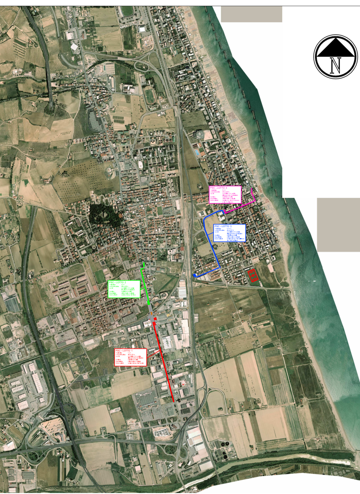
Planimetria su foto - percorso ciclabile di PROGETTO